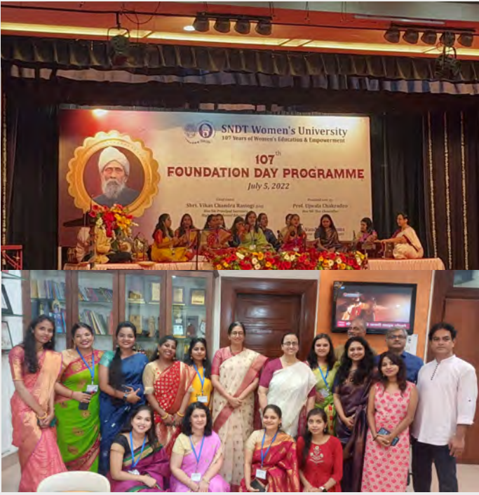
Dept. of Music Churchgate