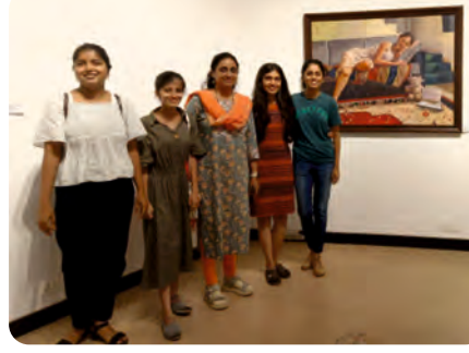
Dept. of Drawing & Painting