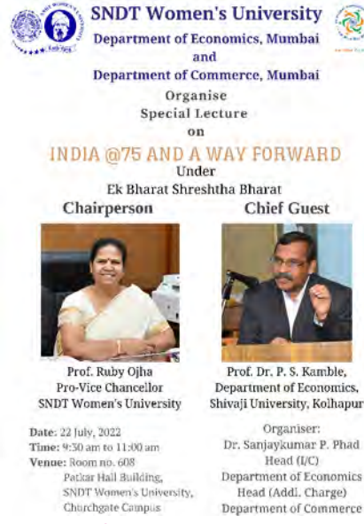
Dept. of Economics